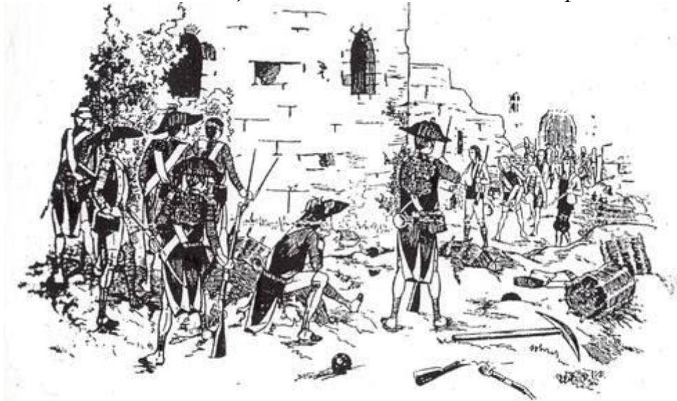
Le vieux château de Saint-Mesmin

Illustration tirée de « Souvenirs du Bocage Vendéen » par Dom Joseph Roux, 1898. Merci à Caroline, du Château de Saint-Mesmin pour cette source.