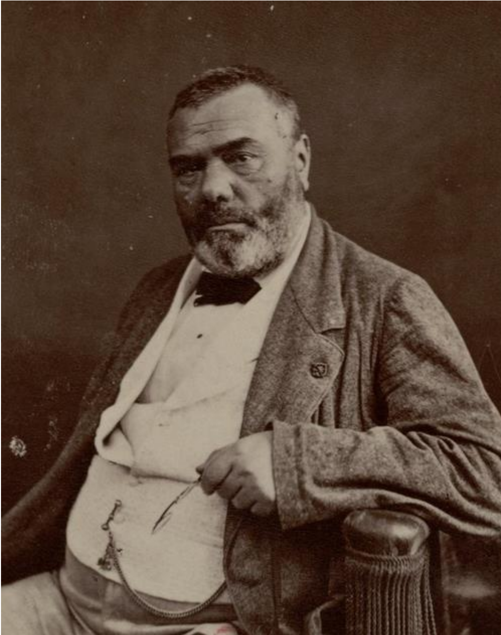
Jacques Créteineau-Joly (1803 – 1875), ici en 1865.

plus aptes à composer des livres idéologiques que de produire de véritables travaux d'histoire.