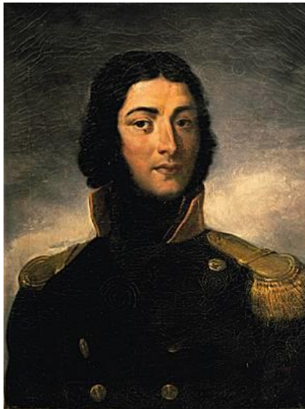
Lazare Hoche (1768-1797), peinture de François Gérard.

A la même date, le commissaire exécutif du département de la Vendée écrit au ministre de la guerre (si la commune de Saint-Mesmin est bien en Vendée, en revanche le château de Saint-Mesmin-la-Ville, se trouve sur la commune de Saint-André-sur-Sèvre, dans le département des Deux-Sèvres). Je n'ai trouvé que le bulletin analytique de cette correspondance qui indique ce qui suit (8) :