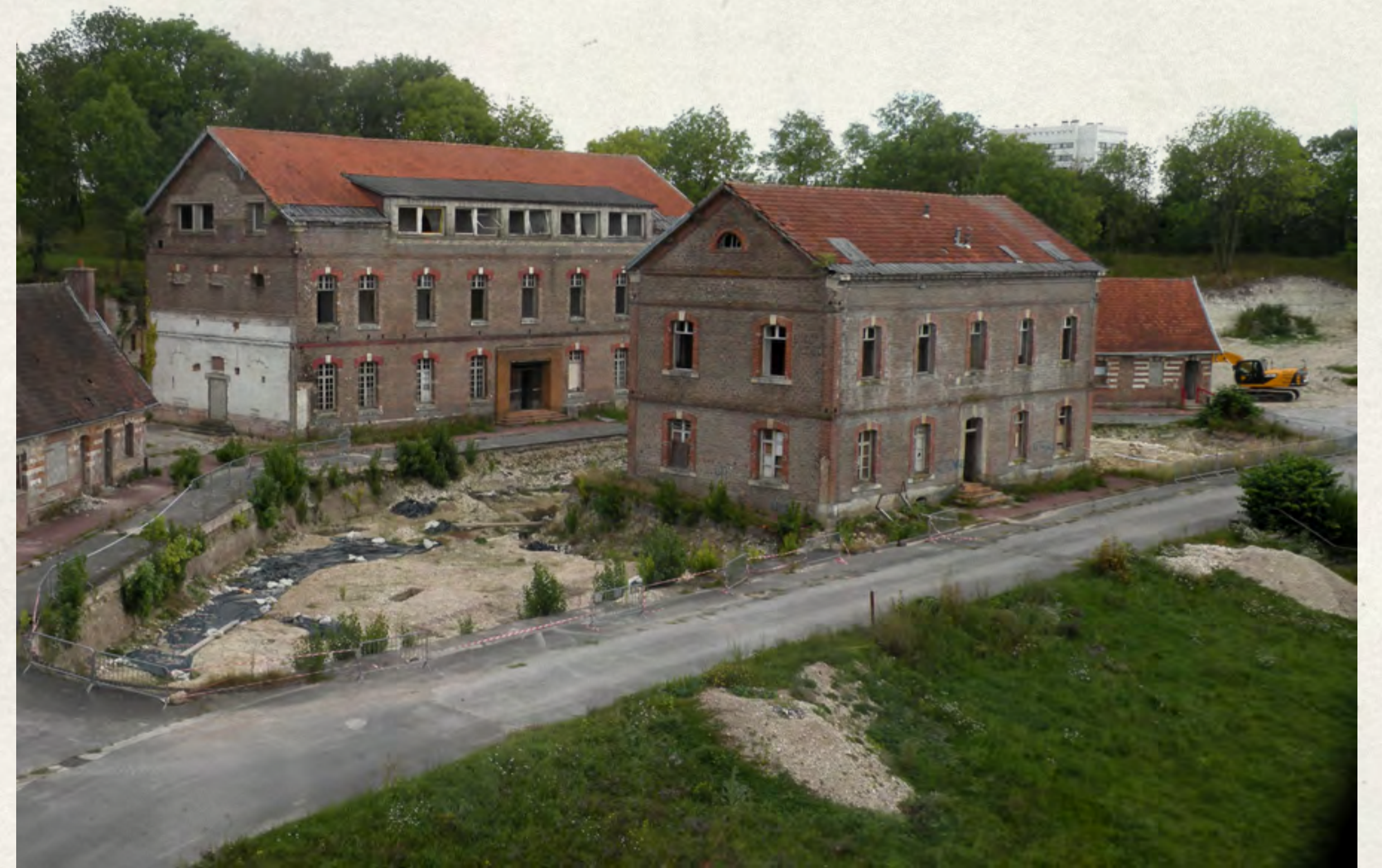
La prison, la gendarmerie et les bâtiments annexes à la veille de leur destruction.

Désormais jusqu'à la libération d'Amiens le 31 août 1944, tout résistant arrêté est emmené à la citadelle et le plus souvent interrogé sur place par la police allemande qui n'hésite pas à utiliser la torture.