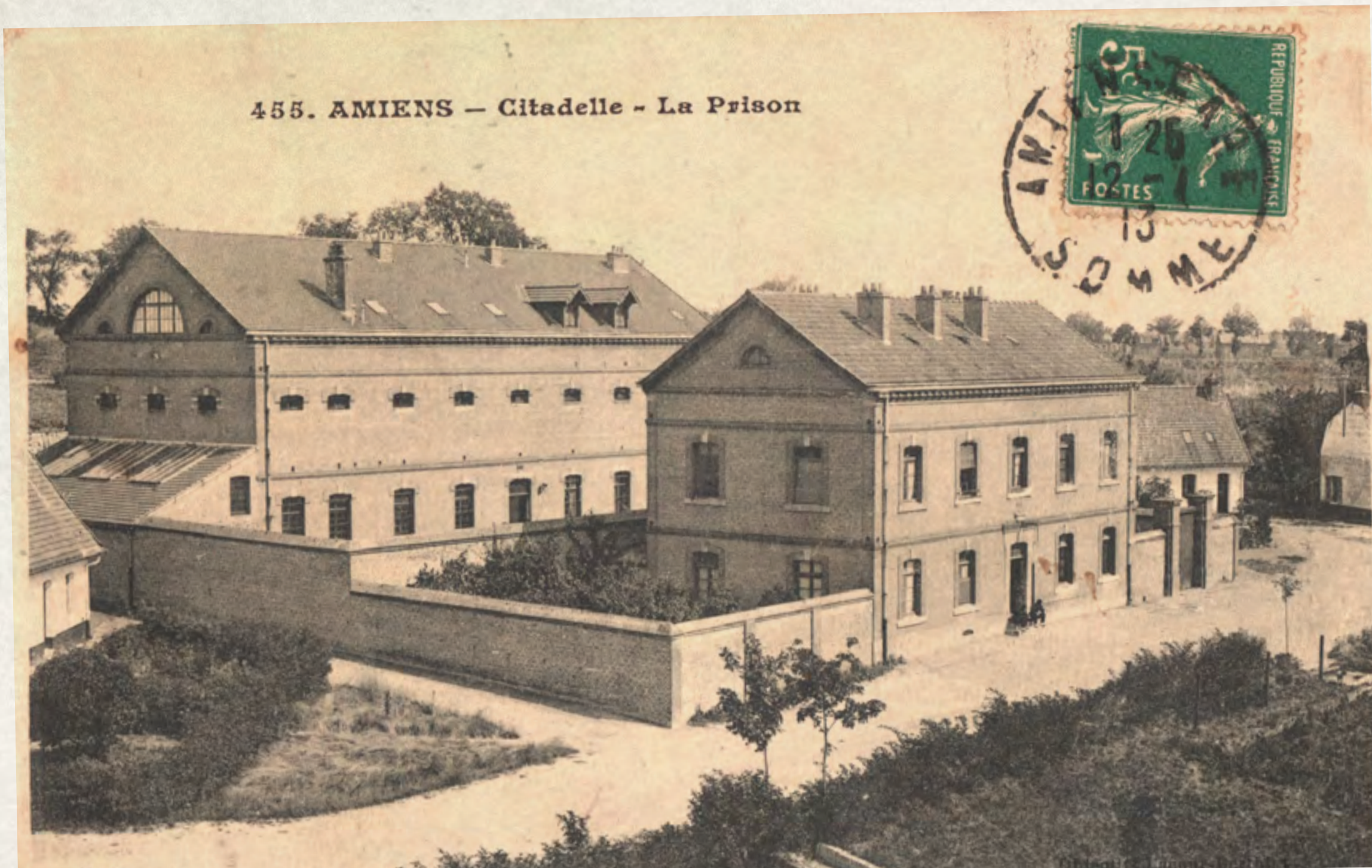
La prison de la citadelle (carte postale début XXe siècle)

18 février 1944, un raid audacieux (Ramrod 564, appelé par la suite opération Jéricho) rend provisoirement inutilisable la prison d'Amiens située route d'Albert. Les forces allemandes décident de placer les résistants emprisonnés ainsi que des détenus de droit commun dans la citadelle.