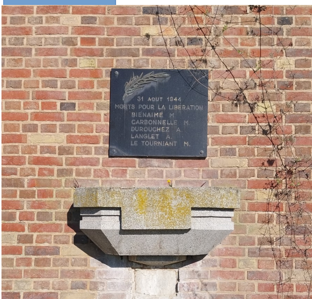
plaque commémorative à l'entrée de la citadelle

Alors que les Amiénois fêtent déjà la libération d'Amiens dans le centre-ville, il reste à prendre la citadelle. D'après combats menés par les résistants, avec des chars britanniques en soutien, se déroulent en début d'après-midi d'abord à l'extérieur de la citadelle puis à l'intérieur, une partie des soldats allemands s'enfuyant par les souterrains.