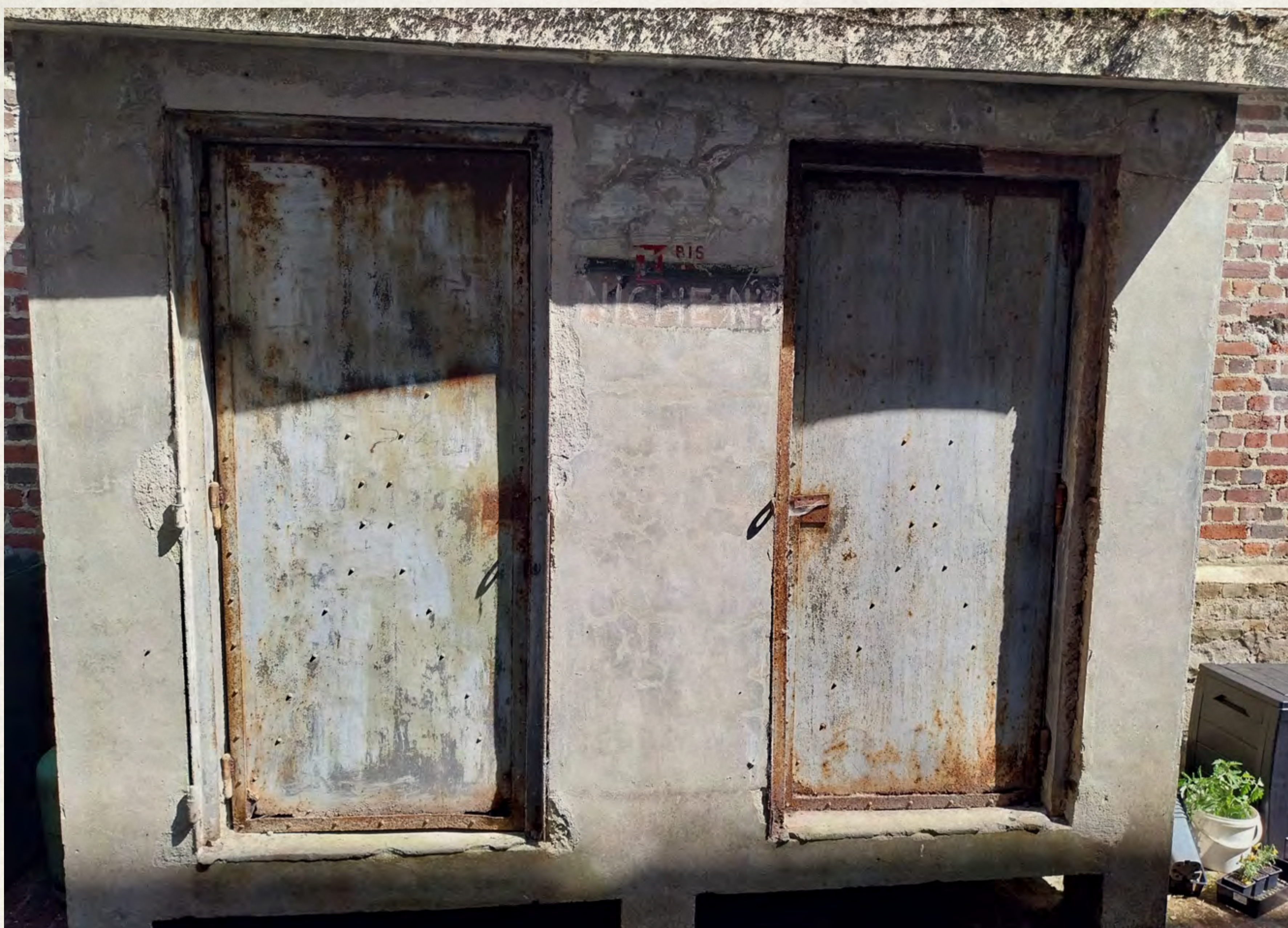
Les « cellules » aujourd'hui toujours en place

Au pied du rempart sud de la citadelle il est possible de voir dans une petite cour trois cabanons réalisés en ciment entre-les-deux-guerres avec de petites ouvertures d'aération.