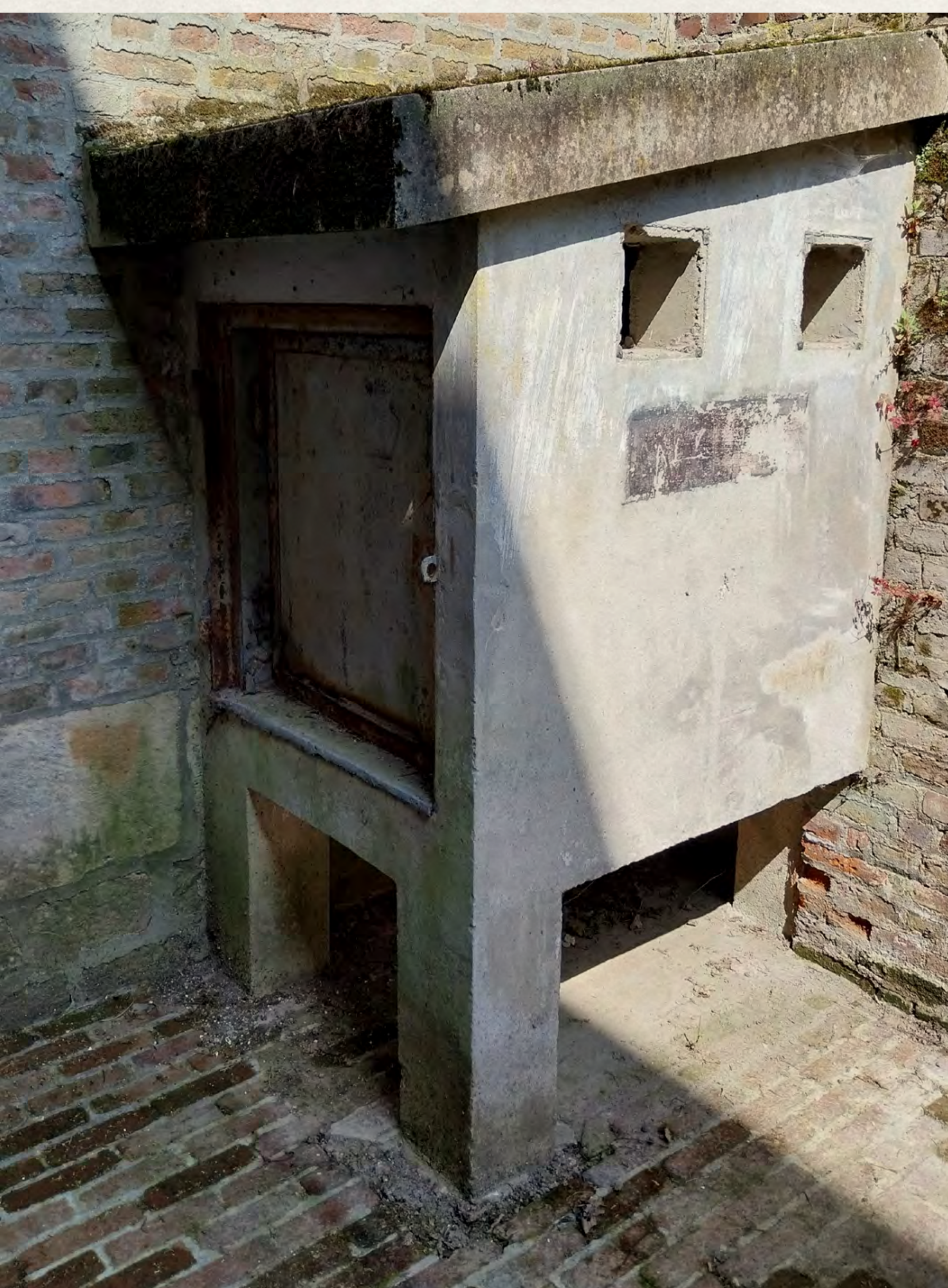
Les « cellules » aujourd'hui toujours en place