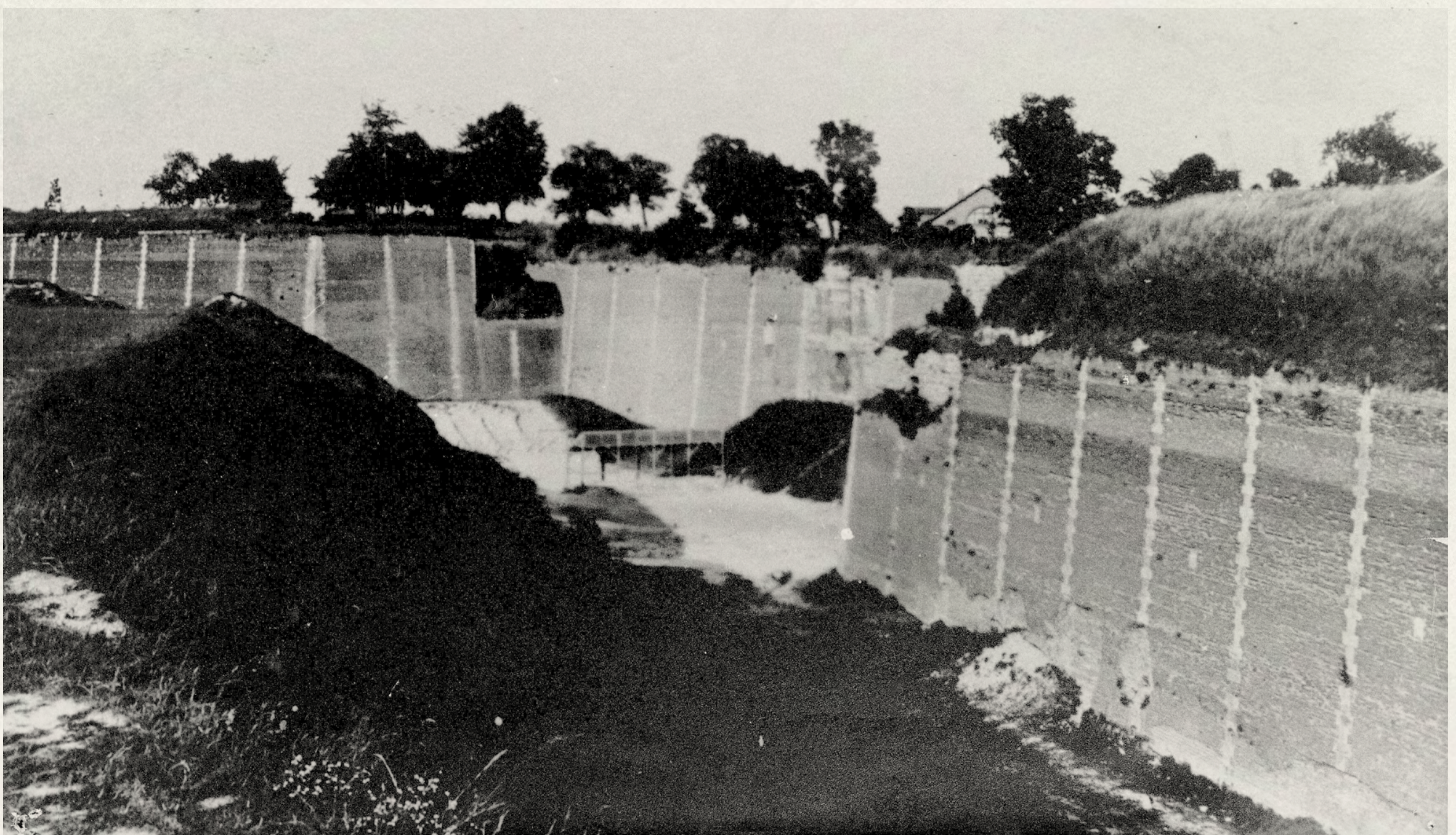
Fossé de la citadelle d'Amiens où se déroulèrent des exécutions sommaires.

Durant les quatre années d'occupation, la citadelle a eu plusieurs rôles.