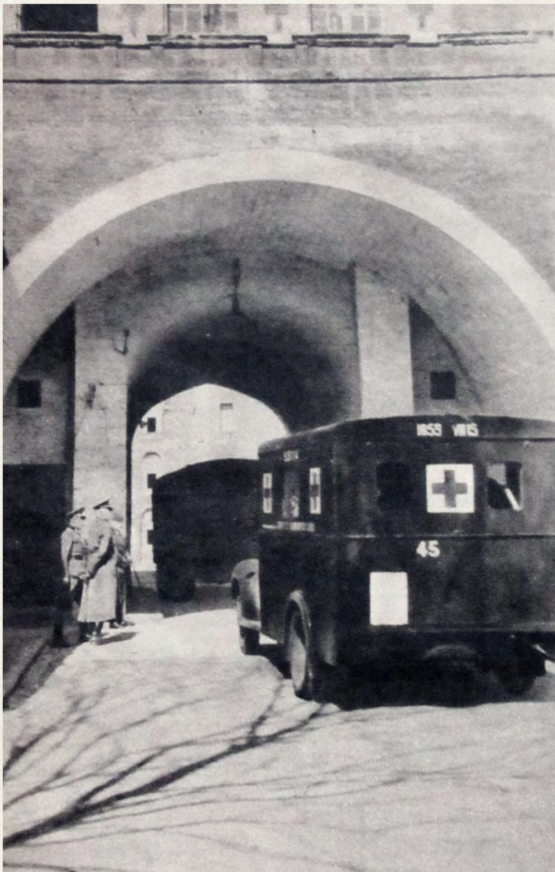
Photographie allemande parue dans la revue « La semaine » (avril 1941). Des véhicules de la Croix-rouge pénétrant dans la citadelle abritant le frontstalag 204.

La citadelle est enfin un lieu d' exécution : 35 à 39 résistants, selon les sources, sont fusillés dans le stand de tir établi dans le fossé ouest.