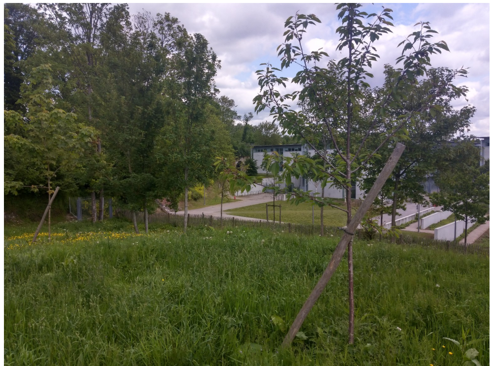
l'emplacement actuel du charnier.