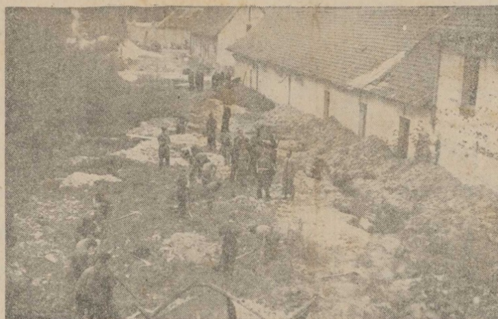
LES FOUILLES SONT EXÉCUTÉES PAR DES PRISONNIERS

Extrait de La Picardie nouvelle du 7 septembre 1944. Archives de la Somme 259PER307