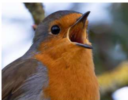
Erithacus rubecula, rouge-gorge femelle.

MIEUX VIVRE À BLANDY et la LPO Île-de-France vous proposent une ballade découverte des chants d'oiseaux