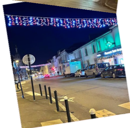
Quartier St Jacques