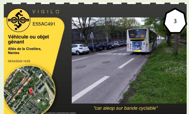
"car aleop sur bande cyclable"