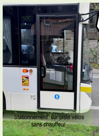
Stationnement sur piste vélos sans chauffeur

Faut-il attendre, que la zone payante s'étende à l'ensemble du quartier pour que les droits élémentaires des riverains soient respectés, ou un débordement de citoyens excédés, ou encore, un accident ? personne ne le souhaite