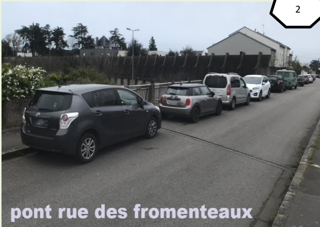
pont rue des fromenteaux

Allez-y, vous avez l'assurance de pas être verbalisé, car personne ne se déplace au-delà du quartier Saint Jacques nouvellement payant.