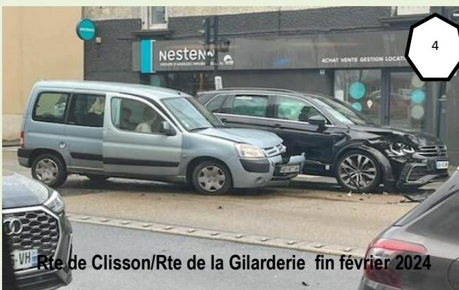
Rte de Clisson/Rte de la Gilarderie fin février 2024

TOUT PROBLEME A SA SOLUTION VOIRE SES SOLUTIONS