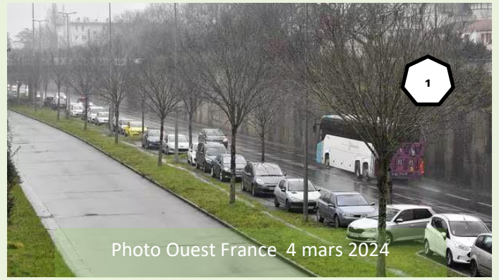
4 mars 2024

Imaginez que vous puissiez vous stationner sur les trottoirs, devant les sorties de garage, sur les pistes cyclables, sur les ponts rendant le croisement impossible...