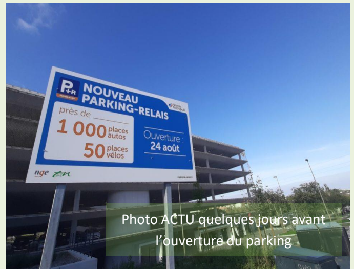
quelques jours avant l'ouverture du parking