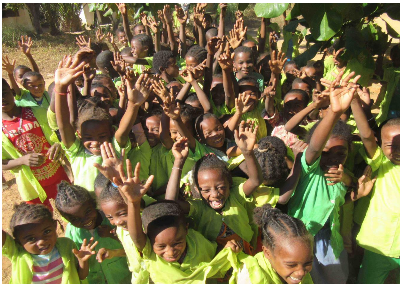
L'accueil enthousiaste des enfants

Depuis notre retour du Paradis Bleu (PB) fin Juin 2018, malgré les quelques mois écoulés, il reste de ce séjour, la sensation forte d'un cercle vertueux qui se serait mis en branle.