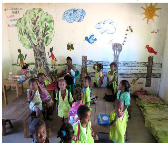
Fresque de l'allée centrale pour les enfants

Notre idée serait de construire un château d'eau avec un réservoir suffisamment important capable d'irriguer les cultures maraîchères. Nous lançons un appel à dons pour ce projet estimé à 3000€.