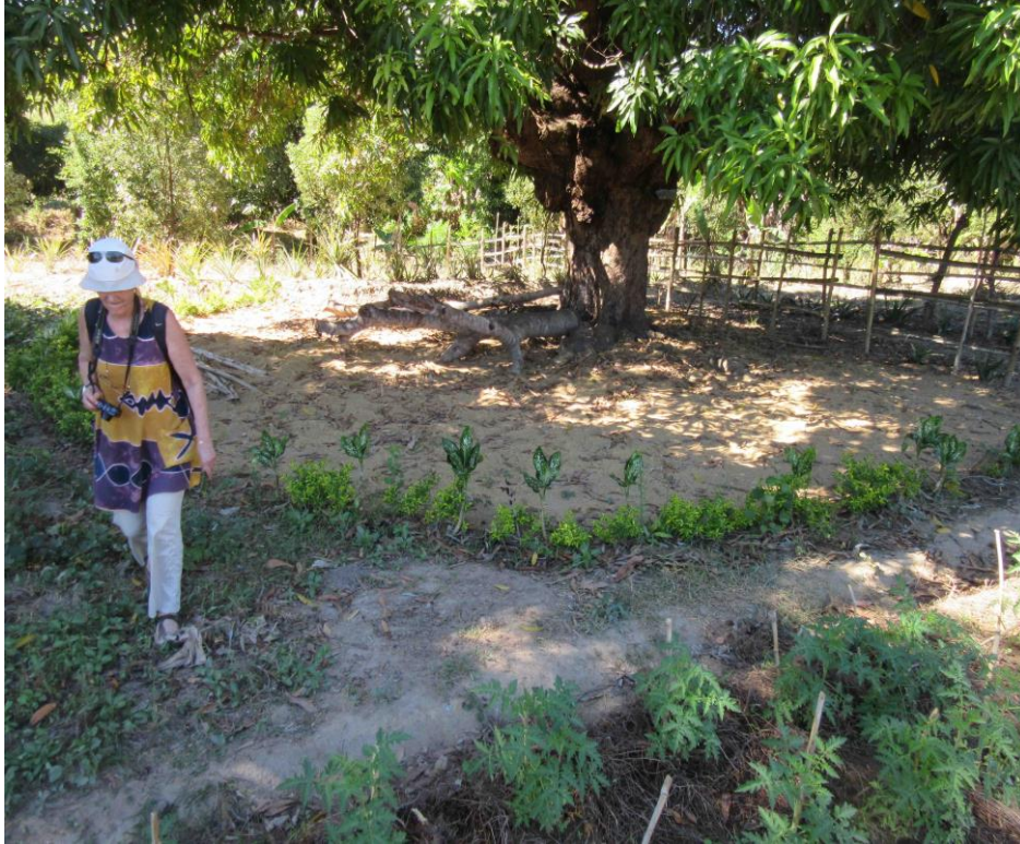
La Base de Vie, côté Avenir

Ce qui nous offre des phrases savoureuses: « Godfrey est parti au marché » ou «Godfrey charge les légumes» ! Et ce Godfrey là remplace avantageusement les brouettes chinoises de si mauvaise qualité, inadaptées au transport des marchandises.