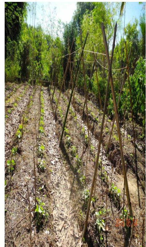
À gauche: les buttes de plantations de concombres au jardin Ravintsara