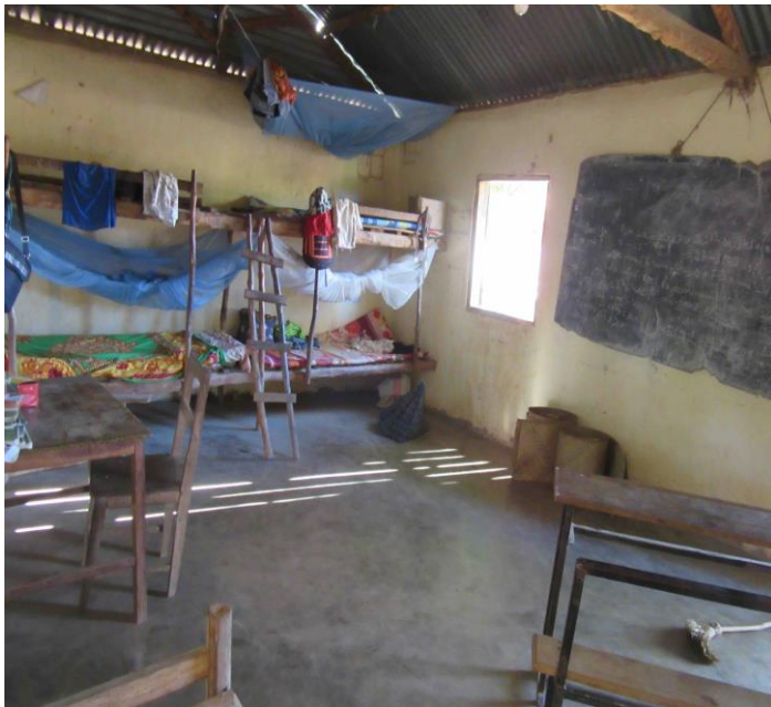
« Chambre » pour 8 jeunes filles