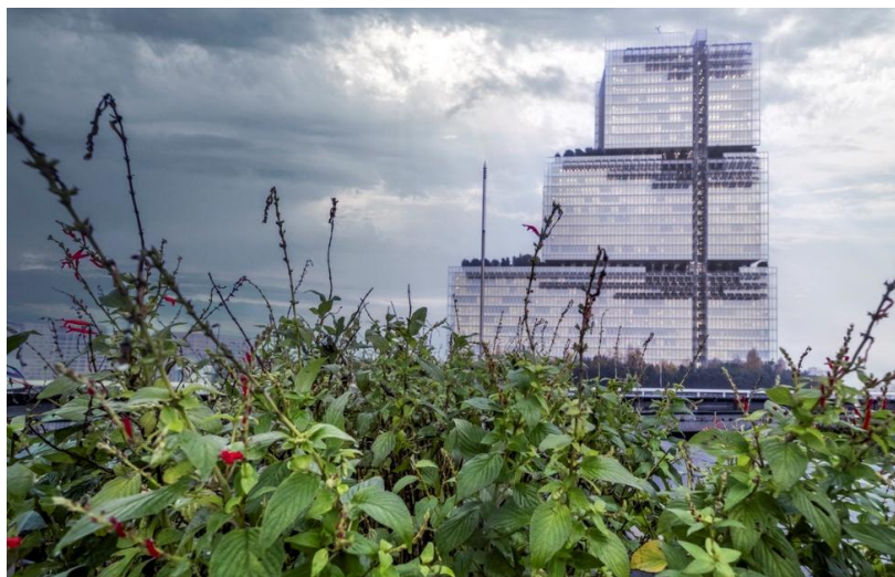
Le tribunal de justice vu depuis le parc Martin Luther King

Jeudi 9 octobre 2025 Rdv à 14h et Vendredi 10 octobre 2025 Rdv à 14h