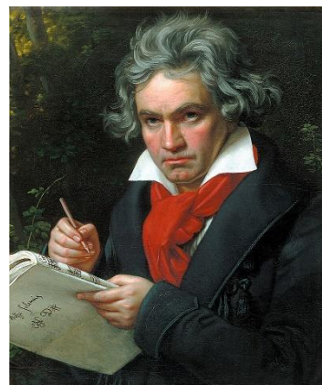
Ludwig Van Beethoven par Joseph Carl Stieler (1820)