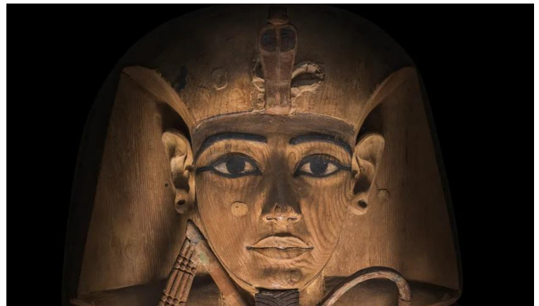
Cercueil en bois de Ramses II

Ses représentations sont innombrables. Il a laissé à la postérité en particulier des colosses exceptionnels.