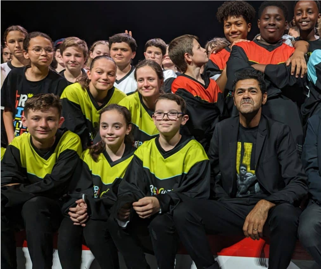
Après la finale, Jamel Debbouze a remis le premier prix et fait des photos avec les jeunes.

Avec ton abonnement, retrouve ton magazine en version numérique sur le site Fleuruspresse.com !