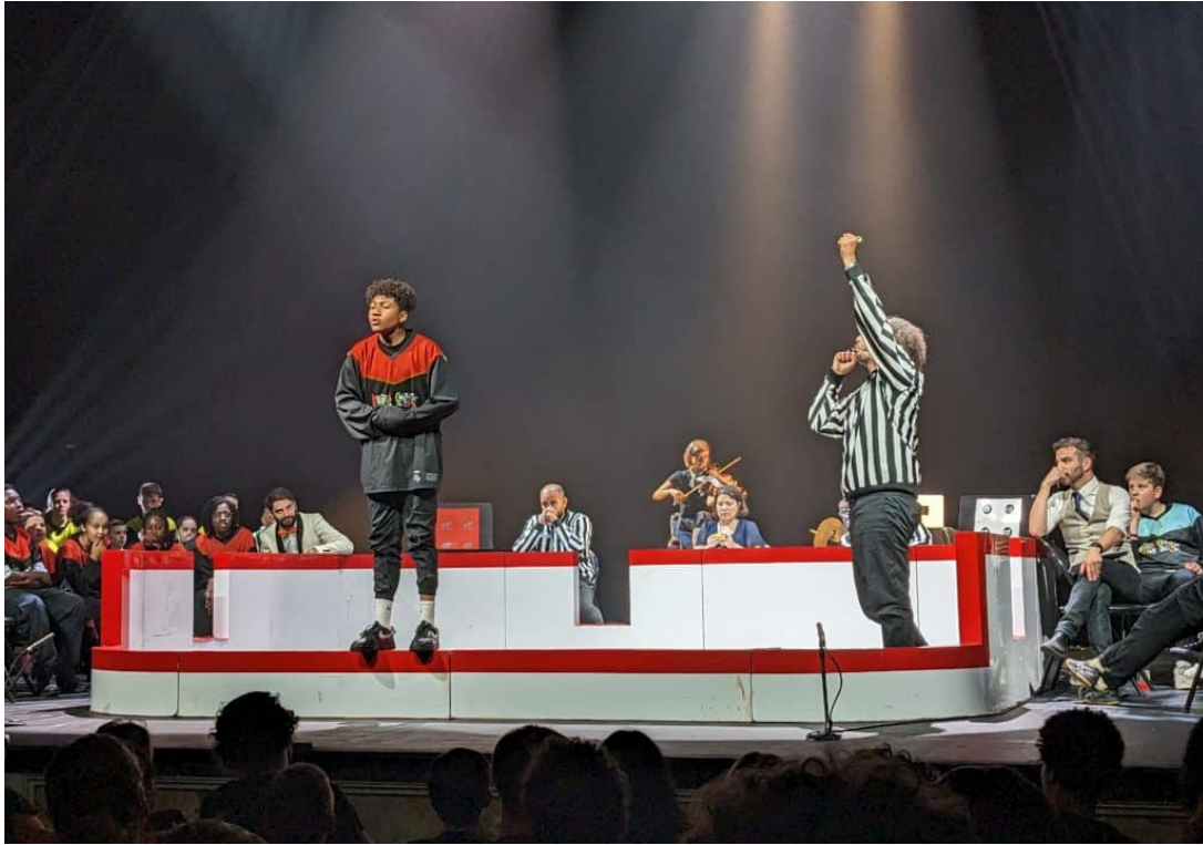
Sur scène, les impros s'enchaînent sous l'œil des arbitres.

Avec ton abonnement, retrouve ton magazine en version numérique sur le site Fleuruspresse.com !