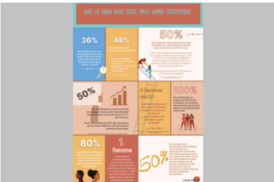
Empow'Her Fellowship : la nouvelle initiative pour reconnaître, connecter et épauler les entrepreneuses sociales