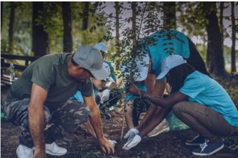
Cap sur la protection de l'environnement et du climat