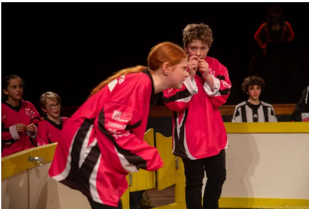
Des collégiens d'Indre-et-Loire participent à des matchs d'improvisation, dans le cadre du Trophée d'improvisation Culture et diversité.