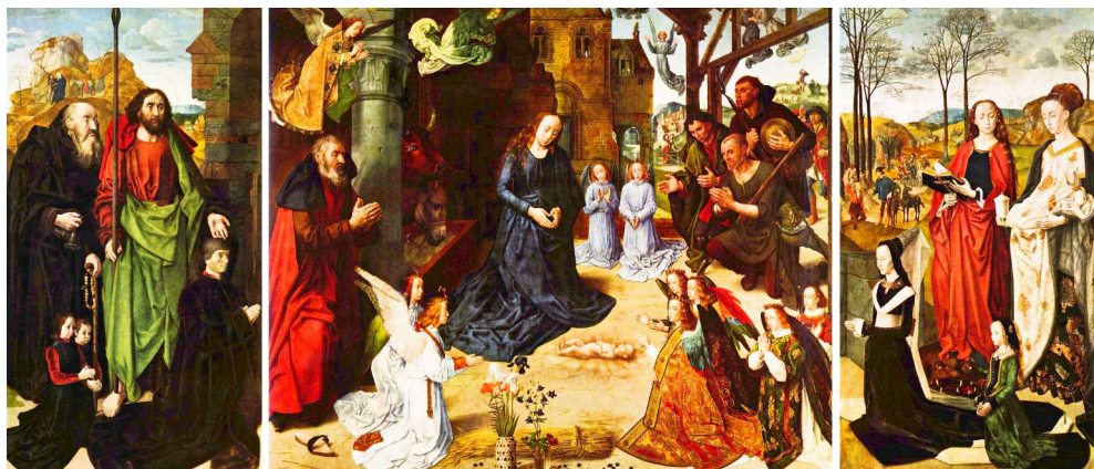
Hugo van der Goes (1475-77)