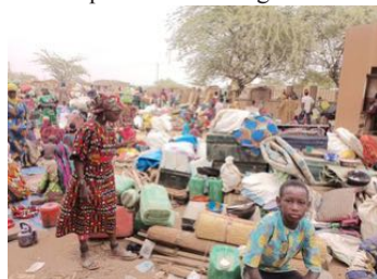
Les déplacés en masse à Gorom Gorom