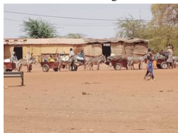
Des déplacés du nord sahel qui fuient leur région