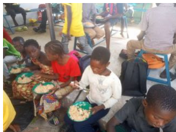
La Cantine Aden et Eve à Tenkodogo