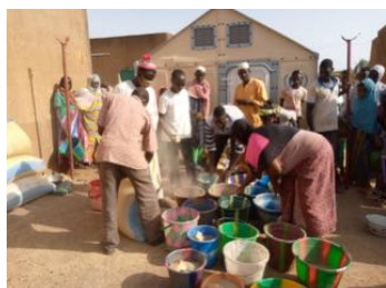
Distribution à Gorom Gorom