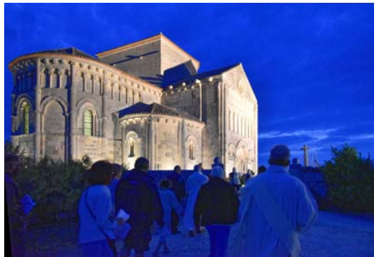
Arrivée de la procession de l'an dernier à Talmont

portés comme cet antique pèlerinage à l'ermitage Saint-Martial ou les processions mariales que nous aimons rejoindre à l'occasion de la fête de l'Assomption de Notre-Dame.