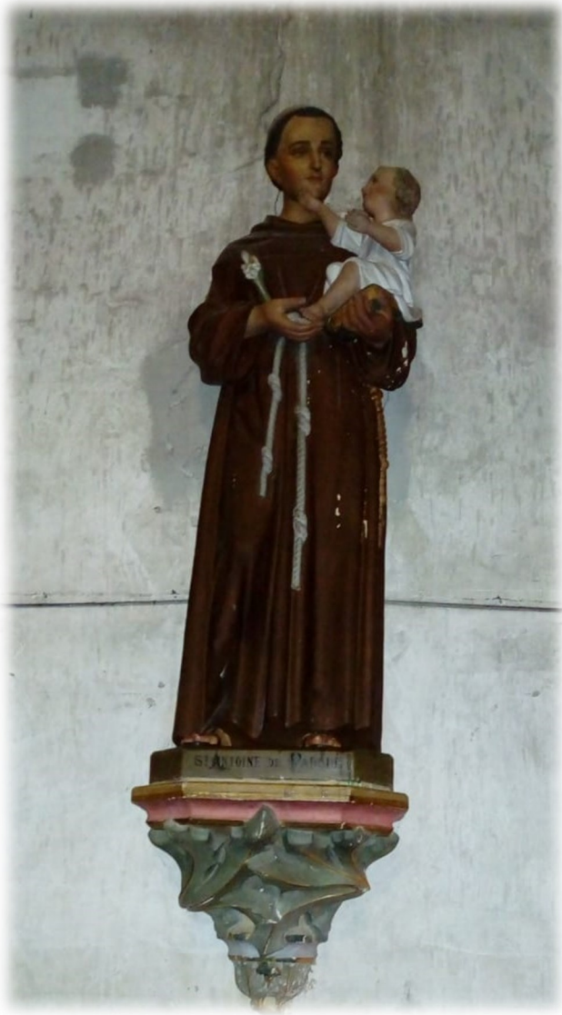
Qui est Saint Antoine de Padoue ?