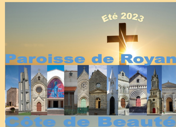
Eglise Saint Georges St Georges de Didonne