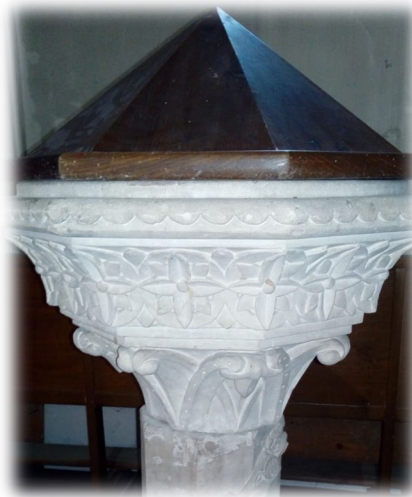
Qu'est-ce qu'un baptistère ?