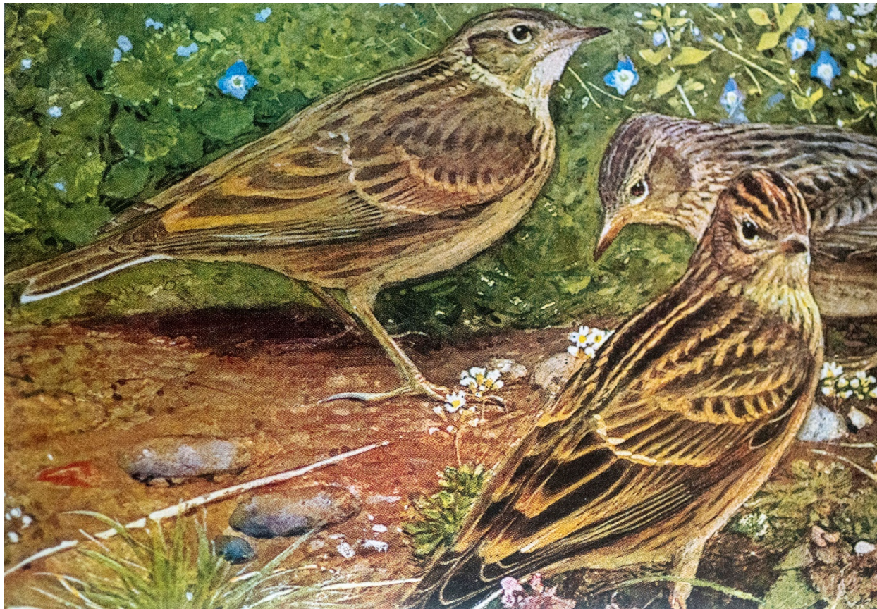
Aquarelle de Léo-Paul Robert

Paul Géroutet, les passereaux d'Europe Tome 1 p 175