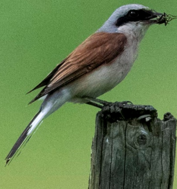
Pie grièche écorcheur mâle