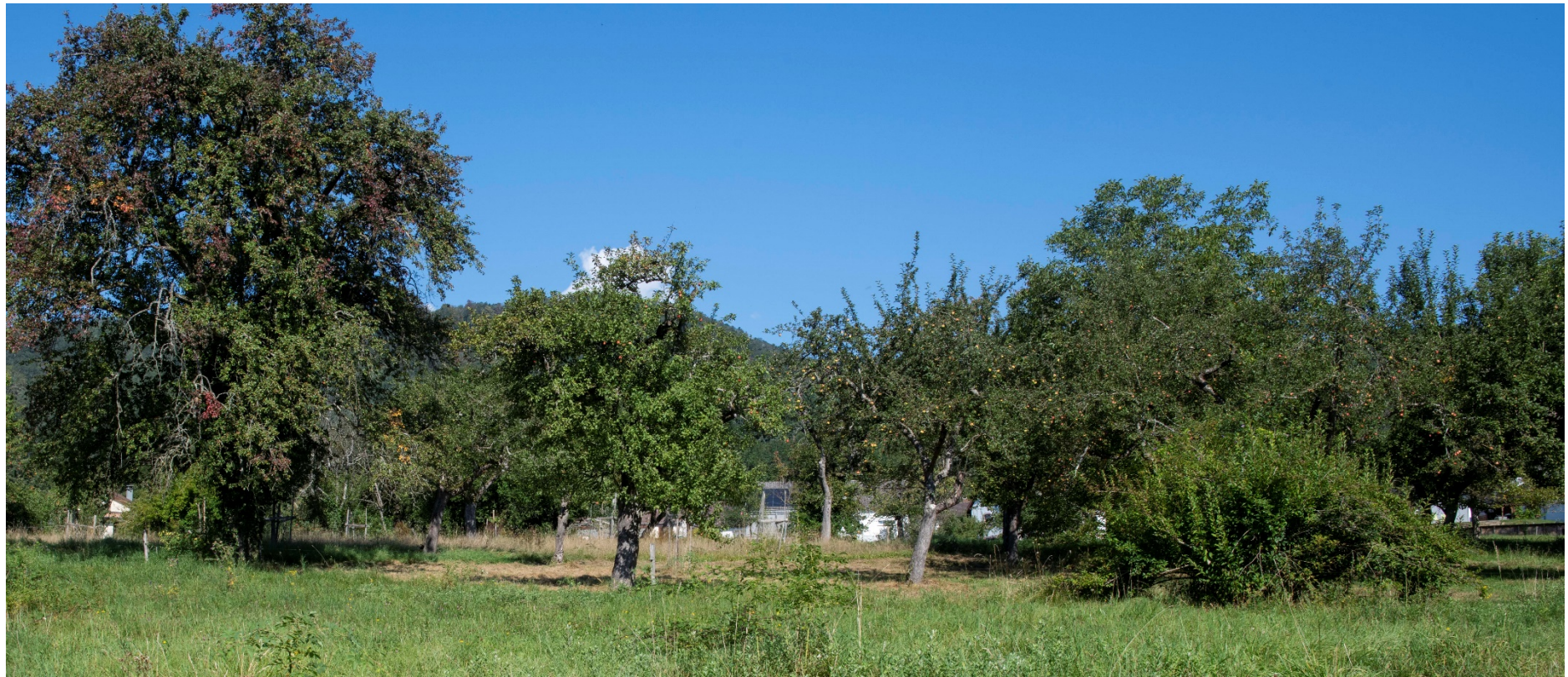
Rue de la chapelle, vieux verger refuge LPO: il est utilisé pour récupérer des greffons de vieilles variétés de fruit. La commune de Lautenbach met à disposition un terrain pour qu'un nouveau verger voit le jour.