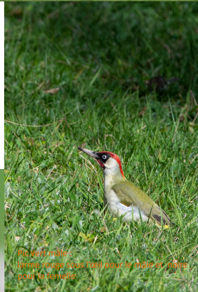
Pic vert mâle : larme rouge sous l'œil pour le mâle et noire pour la femelle