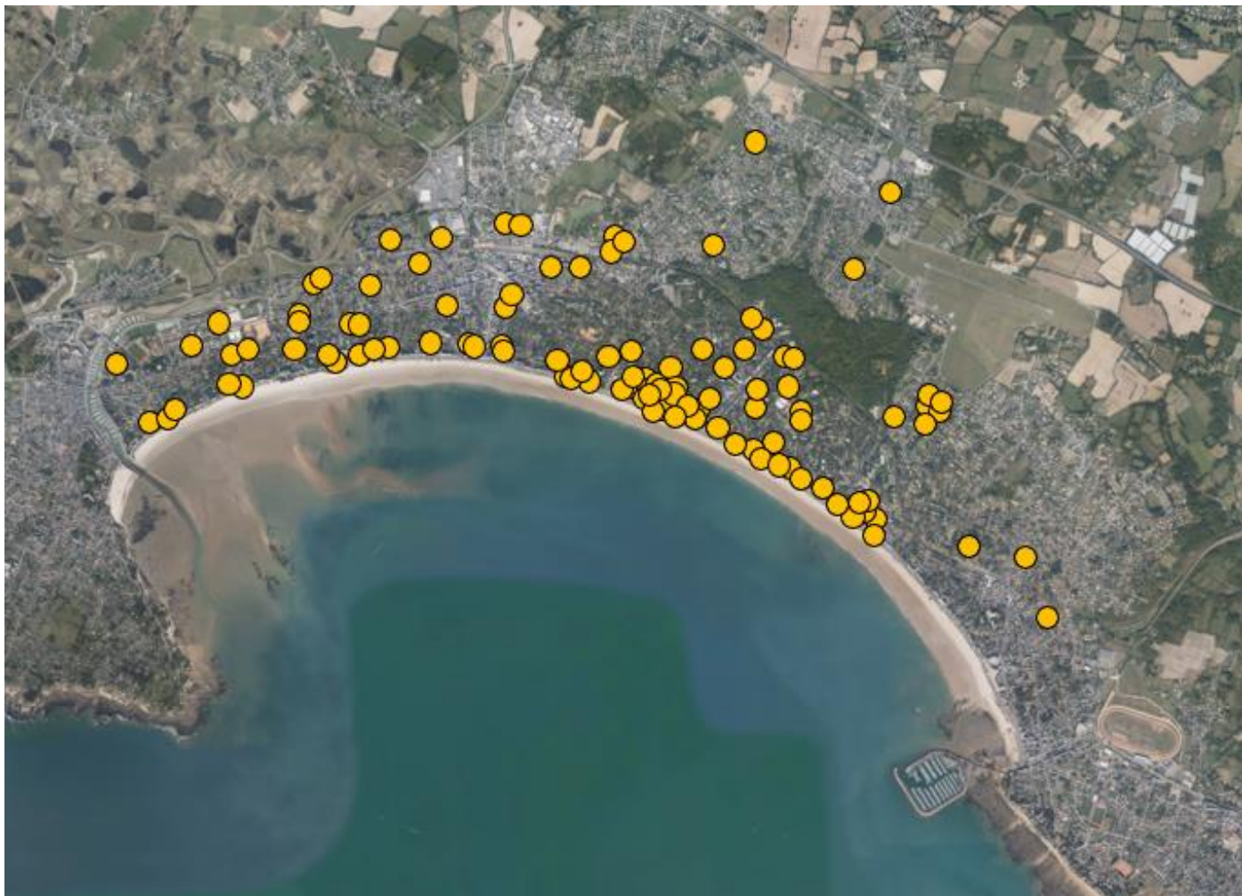
LIEU DE RESIDENCE DES PARTICIPANTS

En amont du temps de travail collectif, les participants ont localisé leur lieu de résidence (principale ou secondaire) sur le plan ci-dessous. On constate une grande diversité d'origine des participants, répartis sur l'ensemble de la promenade de mer et à l'intérieur des quartiers de ville, avec une forte représentation du secteur Lajarrige et De Gaulle. Quelques participants habitent en dehors de ce périmètre.