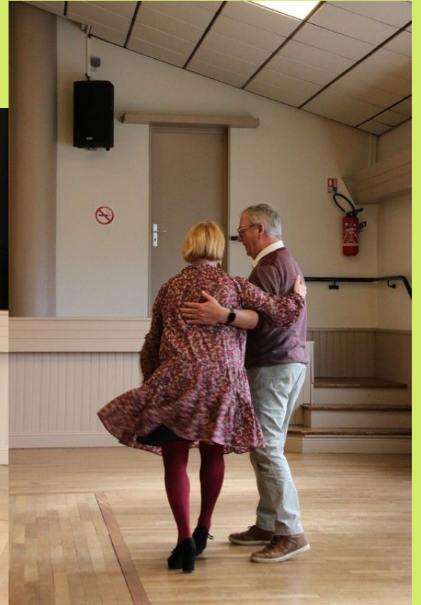
Danseurs sur la piste