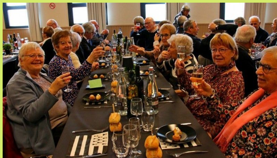
Les tablées à l'heure de l'apéritif