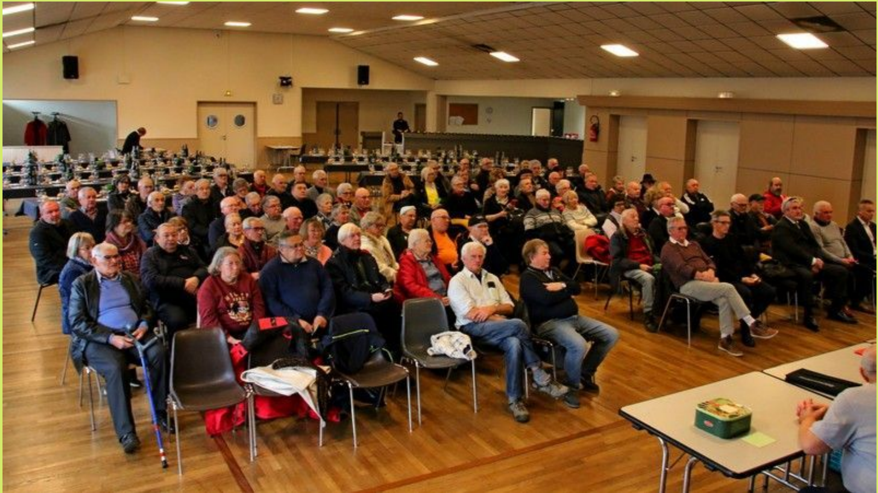
Vue de l'assistance à l'ouverture de la séance