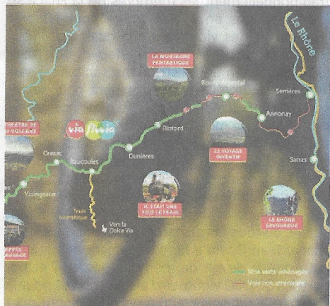
La carte générale de l'itinéraire de la Via Fluvia entre Rhône et Loire.

joindre la vallée du Rhône à Serrières, au niveau du quai Jules-Roche en passe d'être réhabilité, afin d'accueillir cyclistes et randonneurs dans les meilleures conditions. À terme, 120 kilomètres de voie verte relieront Lavoûte-sur-Loire à Serrières. Un tracé en six étapes empruntant, entre autres, l'ancienne voie ferrée Annonay — Saint-Rambert-d'Albon réhabilitée. Reste à déterminer le tronçon final qui arrivera à Serrières au niveau du quai Sud lequel doit être réaménagé dans les mois à venir. Actuellement en cours d'aménagement ce tronçon traverse déjà Saint-Marcel-lès-Annonay pour rejoindre l'entrée d'Annonay avec pour but de relier la voie verte Viarhona et le quai sud de Serrières en passant par Annonay, Vernosc, Thorrenc, Andance, Saint-Désirat, Champagne, Peyraud et enfin