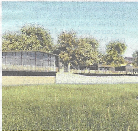
Vue des futures installations depuis le Rhône