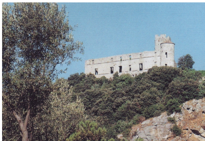
Château de Tornac près d'Anduze.

(Bibliographie : D'après G. ZUCHETTO. Les Editions de PARIS)