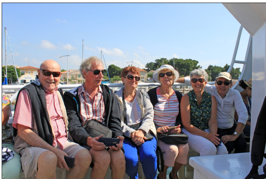
Sortie à l'étang de Thau et la villa romaine de Loupian