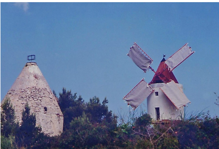
Le moulin avec ses nouvelles ailes et ses meules