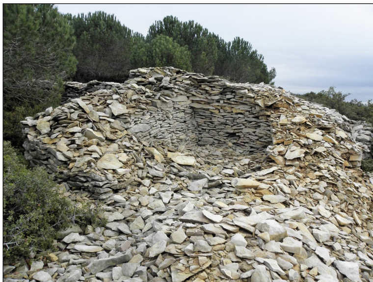
La ruine de la capitelle de la Liquière avant la reconstruction