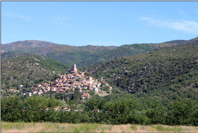
Visite d'Eus, l'un des plus beaux villages de France

18 voyages : Séjour à Venise ; Pézenas et le jardin d'Adrien ; le musée FABRE de Montpellier ; Villeneuve et le cirque de Mourèze ; Palavas, le phare de la Méditerranée et le musée DUBOUT ; la Chartreuse de Valbonne et Vaison-la-Romaine ; le temple bouddhiste Lerab Ling à Roqueredonde ; Marseille, la Vieille Charité, Cassis et ses calanques ; Maison natale de G. DOUMERGUE à Aigues-Vives ; Musée P. VALÉRY et musée BRASSENS à Sète ; Le parc du Cosmos aux Angles ; Hôtels particuliers, Mikvé (bain rituel juif), Arc de triomphe et Château de Flaugergues à Montpellier ; visite du vieux Nîmes et ses hôtels particuliers ; la cathédrale et la fac de médecine à Montpellier ; le télégraphe CHAPPE et le musée de la poste à Gallargues ; Ambrussum, la voie Domitienne et le musée ; La Bastide Virac et le château des ROURES ; la grotte CHAUVET à Vallon-Pont-D'arc ; Notre dame de la garde et le Mucem à Marseille en partenariat avec la FNACA ; l'étang de Thau et la villa romaine de Loupian ; le prieuré de Serrabonna, Prades, l'église de Cailhar et Eus, Pyrénées Orientales.