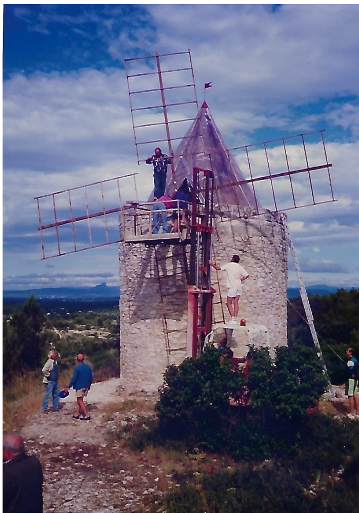
Construction des nouvelles ailes du moulin

L'année 1996, dans le cadre de l'amélioration du patrimoine, est marquée par la plus belle fête de l'été !