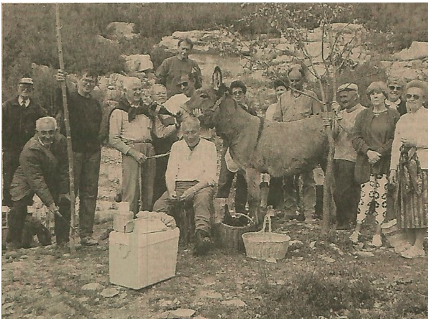
La Fontaine du Coucou en beauté