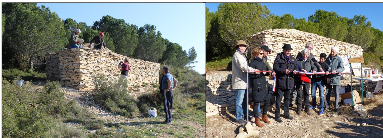
La fin des travaux sur la capitelle de la Liquière et l'inauguration

« La balade du Coucou » a été définie et décrite par nos soins dans l'ouvrage « L'art de la pierre