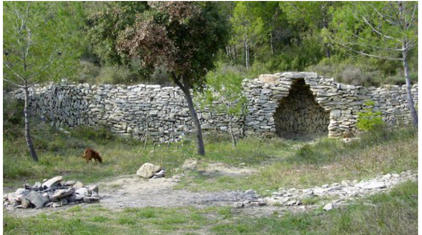
L'abri de berger proche de la Fontaine du Coucou