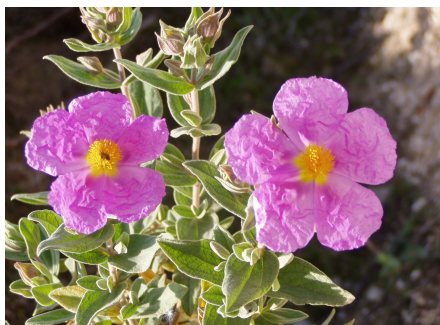
Ciste cotonneux ou ciste blanc Une feutrine blanche sur les feuilles fait office d'isolant contre la chaleur

Depuis 7000 ans, la nature fait histoire commune avec l'homme et ses troupeaux. Le défrichement à la hache ou au feu livra les espaces et la végétation à la dent dure des moutons et aussi à celle du soleil. Pour subsister malgré le surpâturage et pour lutter surtout contre la canicule, les essences de la garrigue ont, depuis, mis au point de nombreuses stratégies aussi insolites qu'ingénieuses.