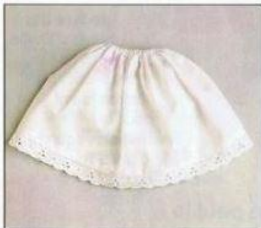
Jupon en coton blanc Pour garnir toutes les robes Réf. 457220 Prix: 26 F

L es accessoires, c'est indispensable. Il suffit parfois d'un petit rien pour transformer l'allure d'une toilette.