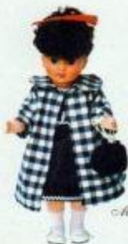
Madeline escape 1040151