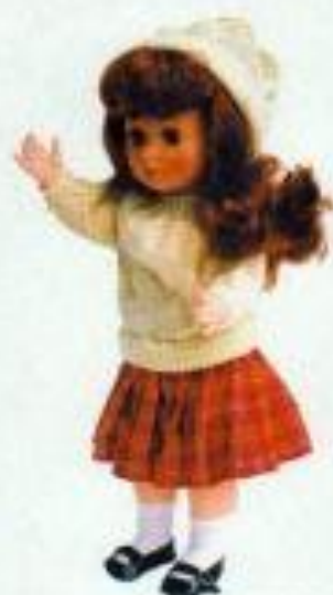
Spirit of winter 1040167