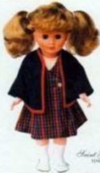
Saint Germain 3040181