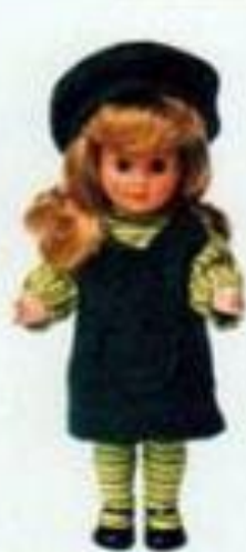
Saint Michel 3040176