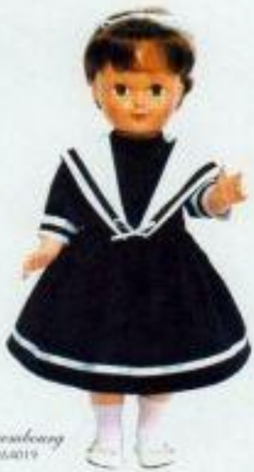
Francette, la Marine 264019