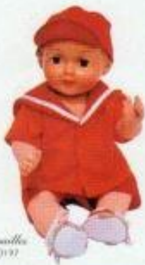
La poupée 2440197