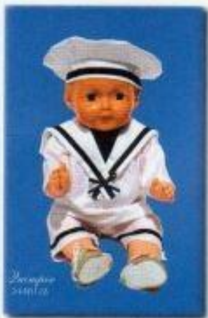
Le capitaine 2440126