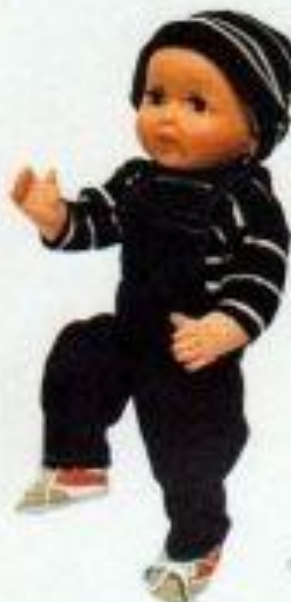
Le bébé 2440121