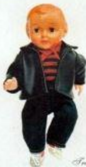
Le coucou 2440159