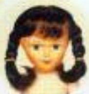
Francette, with braids