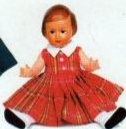
Saint Malo 254010