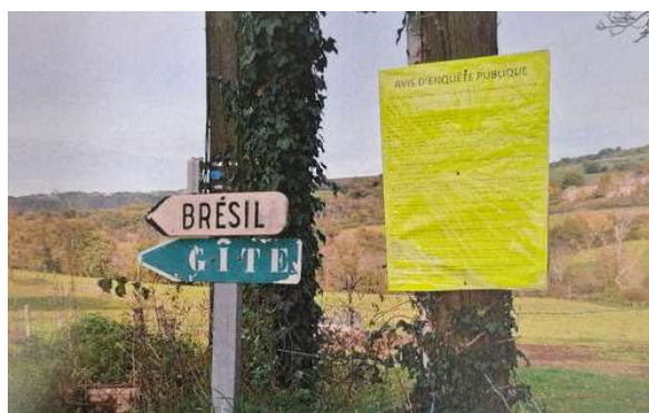
Panneau d'information le Brésil