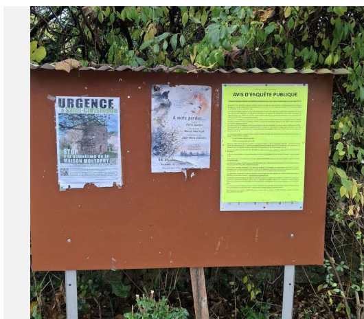
Panneau d'information en mairie