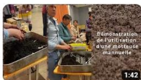
Rencontre des jardins partagés, 2ème édition 110 vues • il y a 2 mois