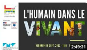
[Replay] Conférence "l'humain dans le vivant" 185 vues • il y a 7 mois