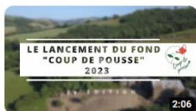
Lancement de la 3ème édition du fonds « Coup de Pousse » ! 62 vues • il y a 1 mois

Et découvrez les vidéos de notre chaîne YouTube (Pôle Territorial Albigeois Bastides)