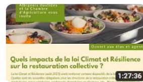
Quel impact de la loi Climat et Résilience sur la restauration collective ? 84 vues • il y a 1 an