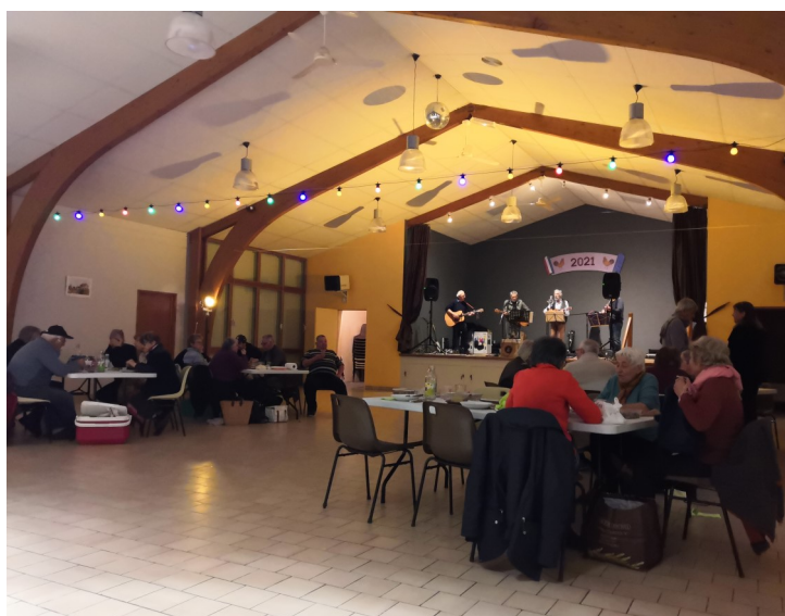
Soirée châtaignes grillées