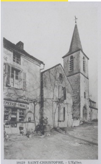
10439 SAINT-CHRISTOPHE. - L'Eglise.