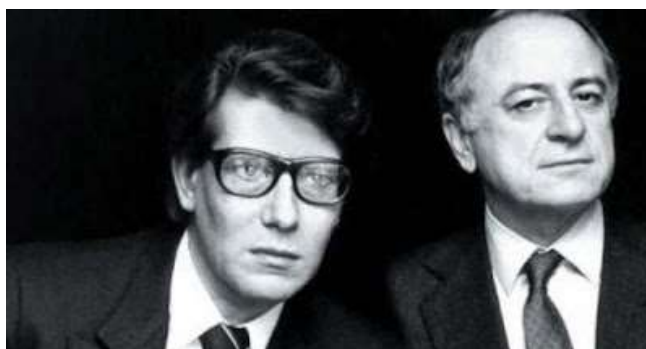
Yves Saint Laurent (à gauche) et Pierre Bergé, son compagnon homosexuel (à droite). Notez l'expression triste du visage d'Yves.