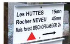
LES PANNEAUX DIRECTIONNELS

L'objectif des panneaux directionnels (PD), à l'image des panneaux routiers, est de renseigner le randonneur sur la direction et les différentes étapes , avec indication du temps de marche en heures . Les différents lieux figurant sur un même parcours seront mentionnés de haut en bas.