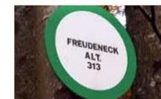
LES PANNEAUX DE LIEU-DIT

Placés au départ, ils sont destinés à présenter le détail d'un circuit de façon symbolisée . Il renseigne le promeneur sur le nom du circuit , sur sa durée (en heures et en minutes), ainsi que sur les divers points de passage .