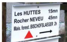
LES PANNEAUX DIRECTIONNELS

L'objectif des panneaux directionnels (PD), à l'image des panneaux routiers, est de renseigner le randonneur sur la direction et les différentes étapes , avec indication du temps de marche en heures . Les différents lieux figurant sur un même parcours seront mentionnés de haut en bas.