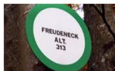
LES PANNEAUX DE LIEU-DIT

Placés au départ, ils sont destinés à présenter le détail d'un circuit de façon symbolisée . Il renseigne le promeneur sur le nom du circuit , sur sa durée (en heures et en minutes), ainsi que sur les divers points de passage .