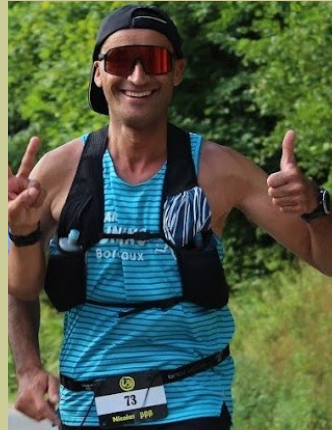
FRA (33) — 1973

100 km 12 h 39 12 h 85 km 24 h 161 km 48 h 211 km