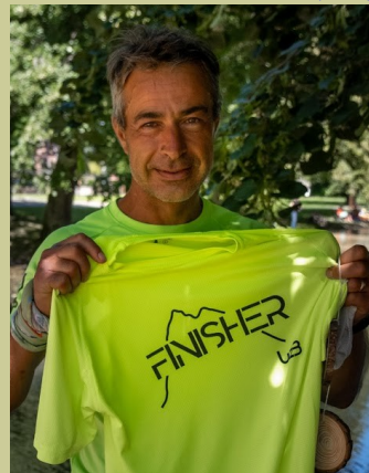
FRA (24) — 1970

100 km 9 h 30 100 mi 21 h 59 12 h 113 km 24 h 221 km BackYard 402 km