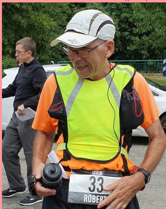
FRA (33) — 1957

100 km 9 h 52 100 mi 23 h 41 12 h 110 km 24 h 207 km 48 h 321 km 6 jours 744 km 8 jours 1004 km