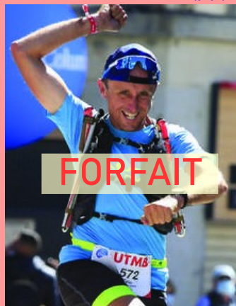
FRA (77) — 1978