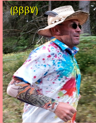
FRA (13) — 1969

100 km 10 h 46 100 mi 23 h 41 12 h 92 km 24 h 159 km 48 h 250 km 6 jours 612 km