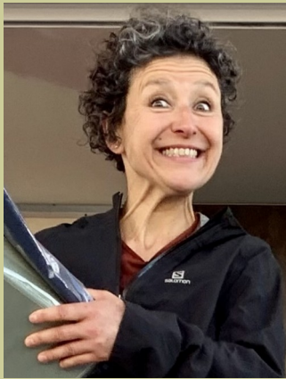
FRA (68) — 1972