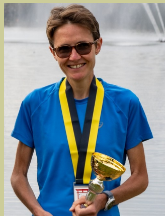
FRA (67) — 1977

100 km 9 h 19 100 mi 20 h 46 12 h 113 km 24 h 203 km