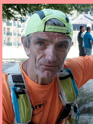
SUI (SUI) — 1959

100 km 7 h 38 100 mi 18 h 14 12 h 136 km 24 h 249 km 48 h 378 km 6 jours 842 km