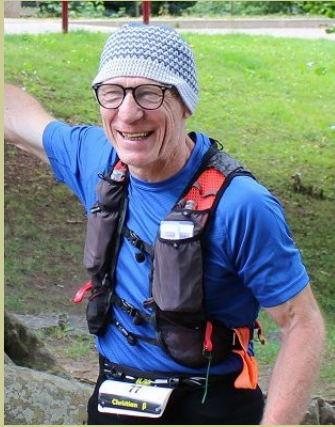
FRA (77) — 1962

100 km 10 h 38 100 mi 25 h 18 24 h 181 km 48 h 283 km