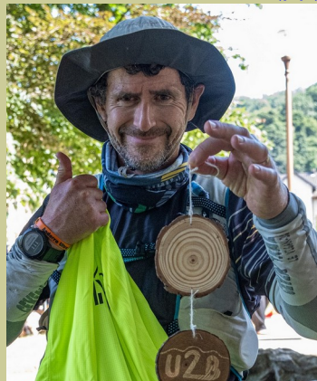
FRA (84) — 1969

100 km 13 h 48 100 mi 24 h 02 24 h 165 km 48 h 245 km