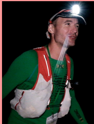
FRA (94) — 1981