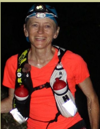
SUI (SUI) — 1972

100 km 8 h 41 100 mi 16 h 10 12 h 129 km 24 h 236 km 48 h 378 km