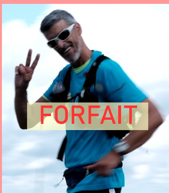
FRA (54) — 1972