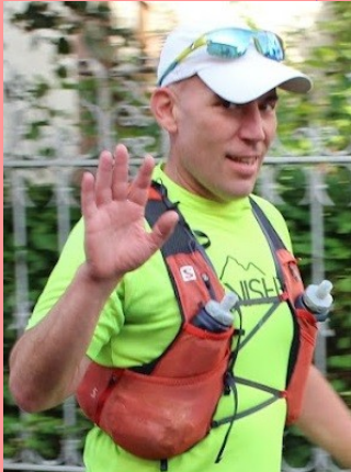
FRA (91) — 1978