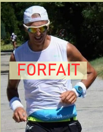
FRA (84) — 1965

100 km 12 h 43 100 mi 26 h 26 24 h 150 km 6 jours 501 km