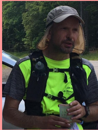
FRA (54) — 1973