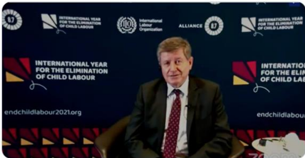
International Labour Organization and 3 others

Partnerships matter, working together, not on commitments but real action to #EndChildLabour2021 .