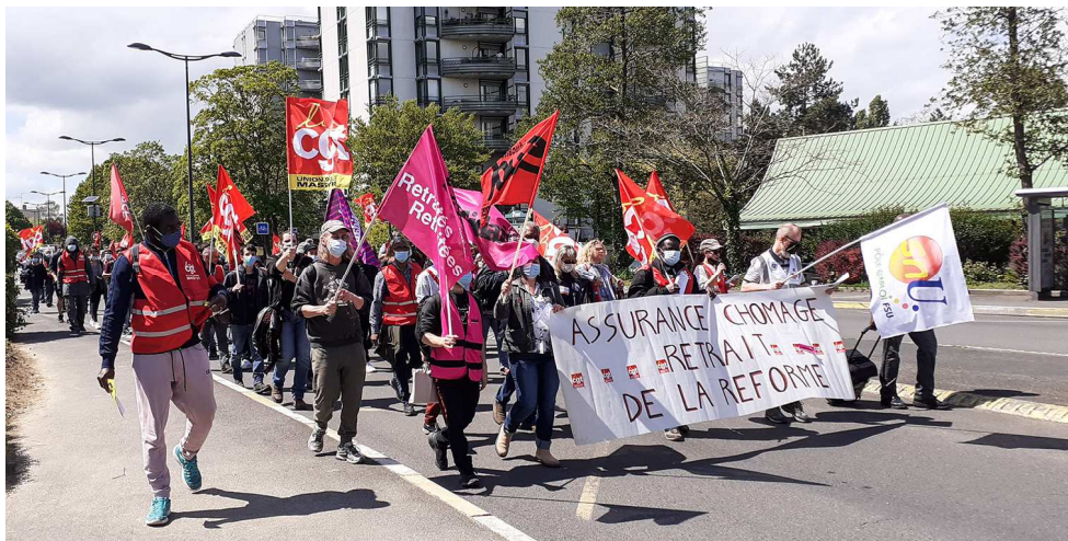
Manifestation à Massy

Rendez-vous Samedi 8 Mai à 14h00 à la piscine de Villaine rue Georges Mandel