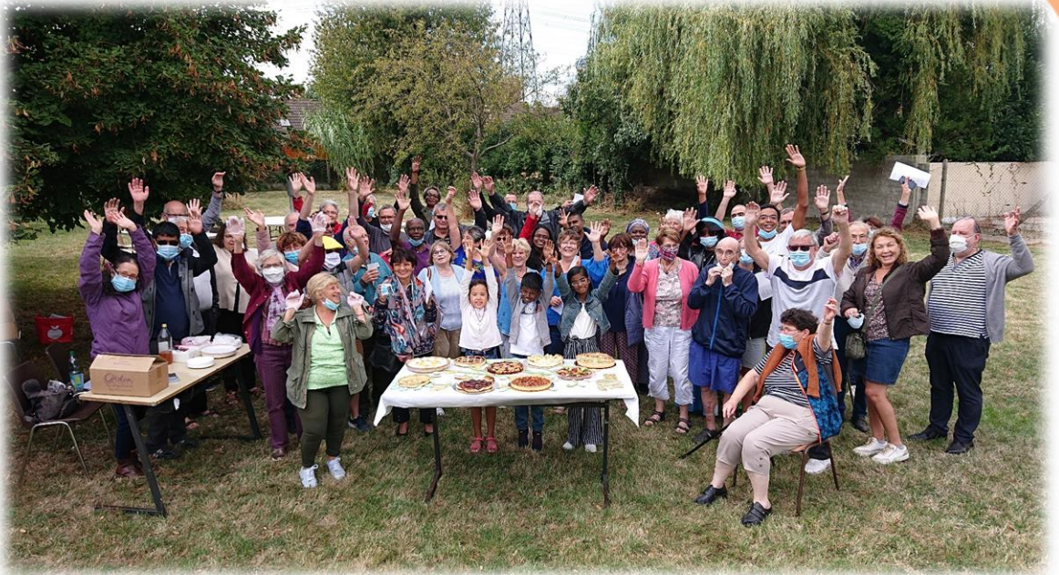
Fête des 70 ans de l'ACO à Roissy en Brie le 6 septembre 2020