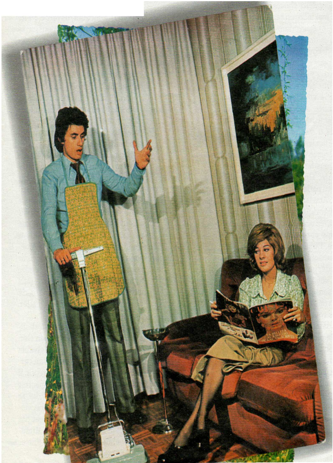
A CHAQUE ÉPOQUE SA REPRÉSENTATION DU RÔLE DE CHACUN DANS LE COUPLE. CARTES POSTALES EXTRAITES DE LA COLLECTION DU PHOTOGRAPHE MARTIN PARR.