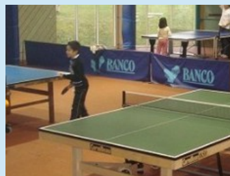
Tennis de table