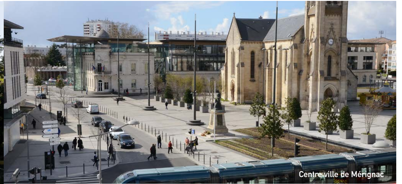
Centre ville de Mérignac