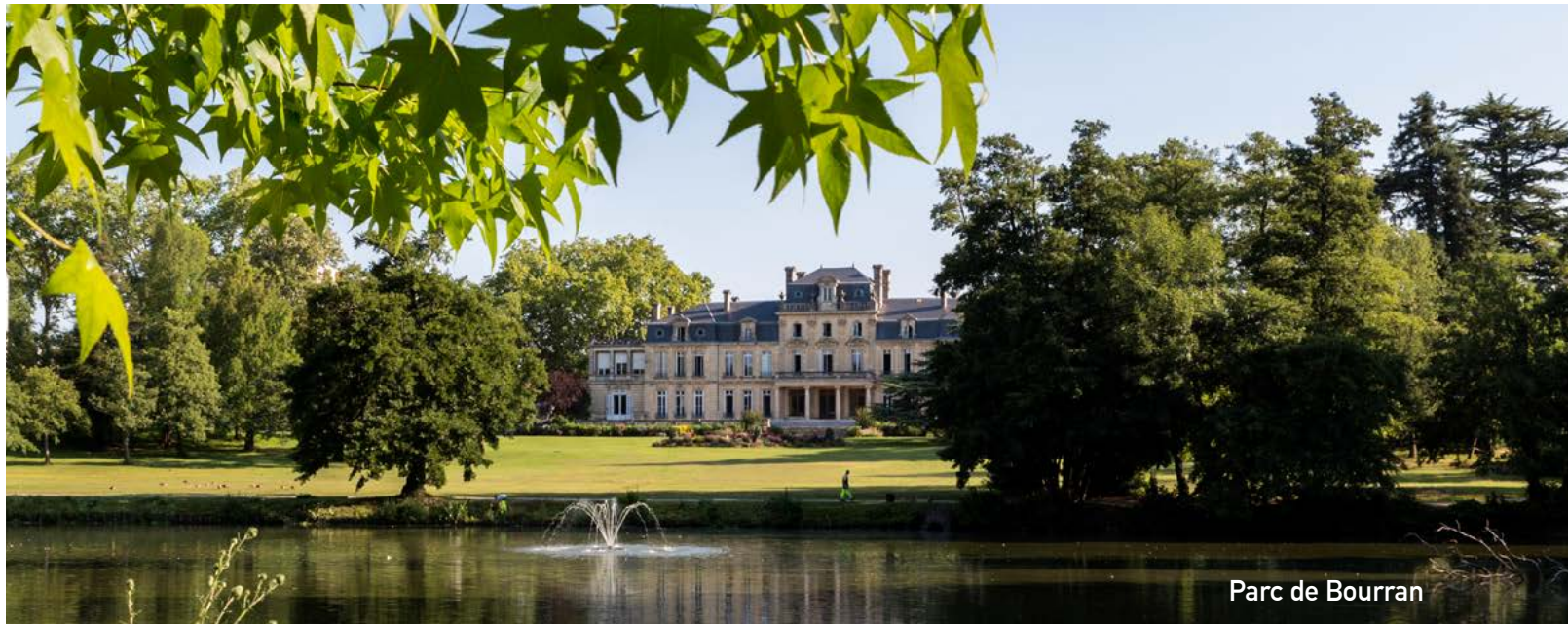
Parc de Bourran