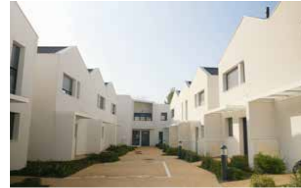
Villa Caudéran - Bordeaux Agence d'architecture : Alonso Sarraute