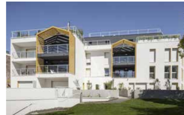
Les Terrasses de Saint-Augustin - Mérignac Agence d'architecture : URB1N