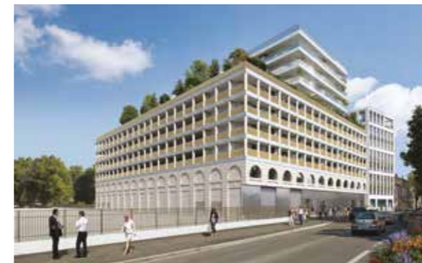
L'Attique de Brienne - Bordeaux Agence d'architecture : COSA Colboc Sachet