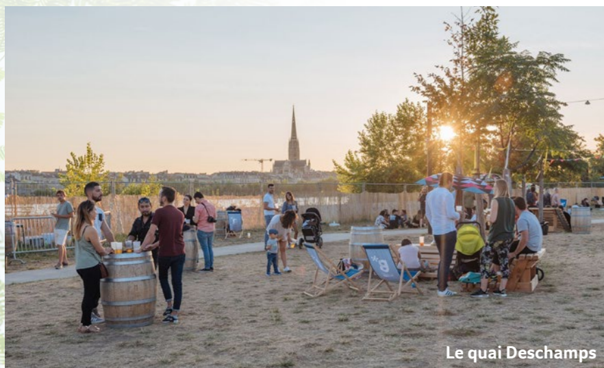
Le quai Deschamps