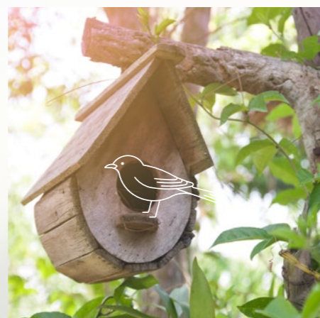
Nichoir à oiseaux