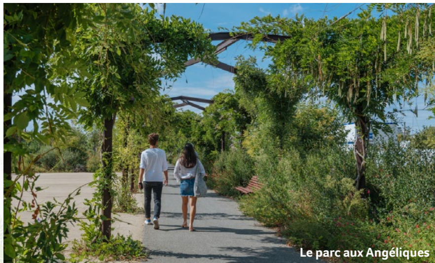
Le parc aux Angéliques