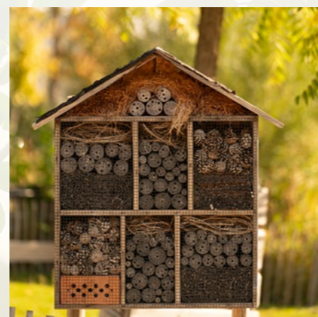
Hôtel à insectes