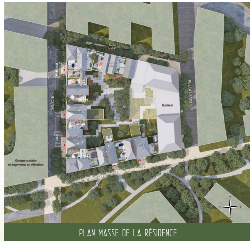
PLAN MASSE DE LA RÉSIDENCE

« C'est une bastide contemporaine qui accueille, en son cœur, un îlot paysager à partager et qui s'ouvre, en périphérie, sur la métropole bordelaise. Ce sont autant de bâtiments mitoyens accolés qui constituent l'écrin de ce jardin en ville.