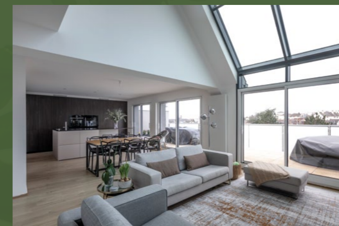
Icone, Rennes (35), Réalisation Groupe LAUNAY