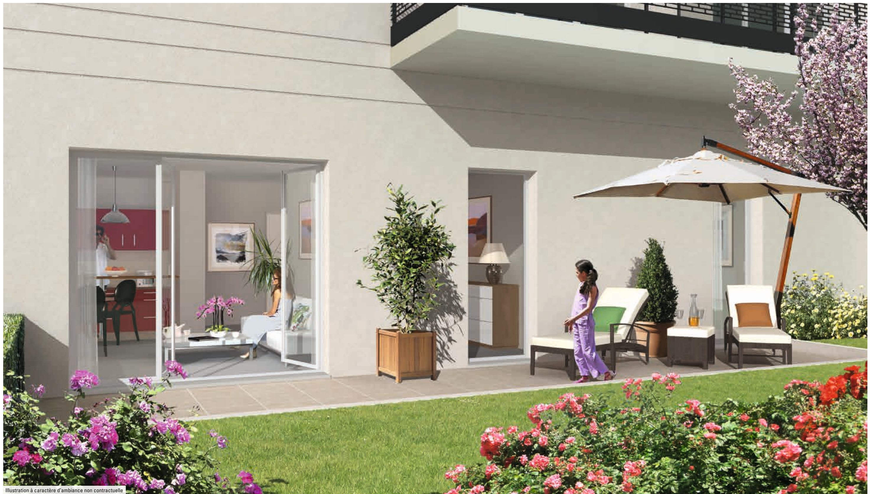
Illustration à caractère d'ambiance non contractuelle