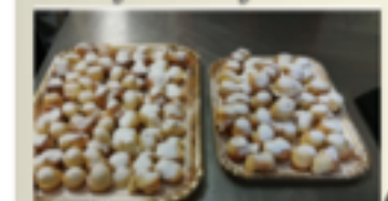
Petits gâteaux grand-mère