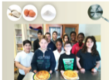
Gâteau au fromage