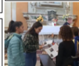
Eglise Saint Sébastien Casalmaggiore

En occasion du jour dédié à "ville des enfants" nos élèves Erasmus se sont transformés en guides touristiques et on décrit les monuments les plus importants de Casalmaggiore aussi que les oeuvres d'art de notre école aux élèves de l'école primaire.