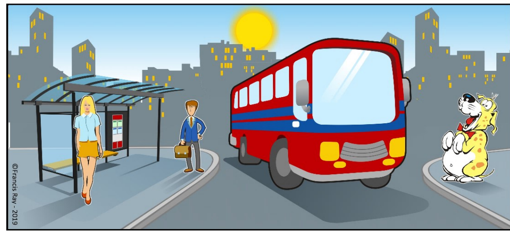
Titus regarde passer le bus.