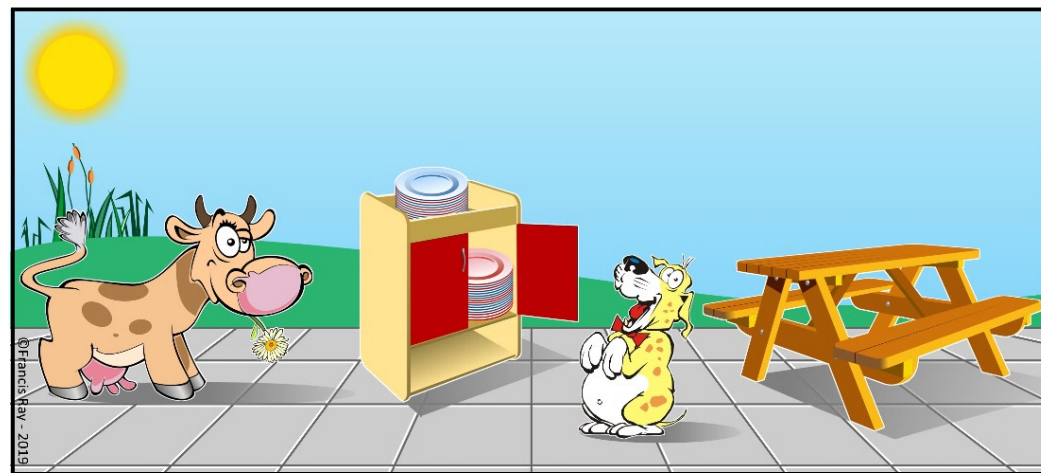
Titus et Tita mettent le couvert sur la table.