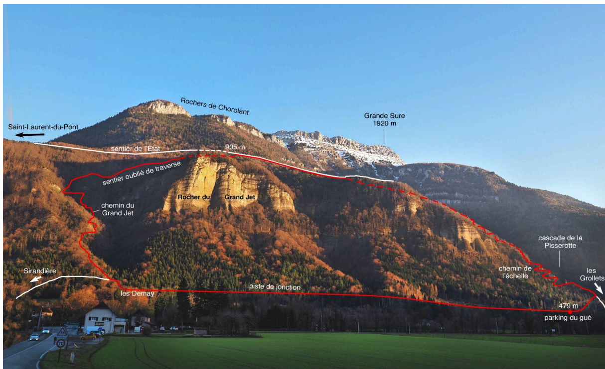
Le Grand Jet vu du Pont de Demay.

1- Il semble qu'à ce niveau, le chemin initial, tracé sur l'IGN de 1950, monte à gauche dans une draye. Mais celle-ci est raide et encombrée, et la trace se perd assez vite. En tout cas, le bout de pointillé qui figure sur l'actuelle IGN est faux, car trop au nord.