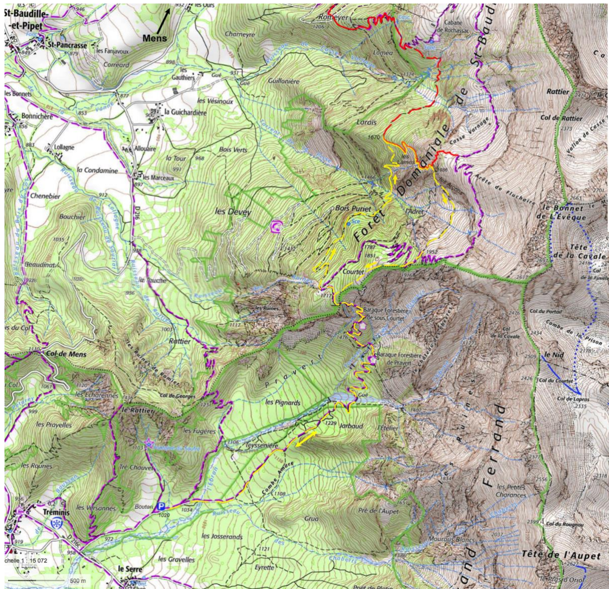
Approche depuis Tréminis (tracé jaune). Pour mémoire, le tracé depuis Longueville est en rouge.

Les Lames : on ne peut manquer ici le sentier bien marqué qui monte à droite (sud-est). Après un grand lacet, il revient à droite vers une série de belles lames rocheuses dans lesquelles il se faufile (jolis passages en corniche), puis au-dessus par de raides lacets jusque à 1886 m. Quelques mètres avant une petite brèche où l'on peut voir les restes d'une vieille clôture, il se divise en deux (à gauche, c'est le chemin du retour si l'on est venu de Longueville).