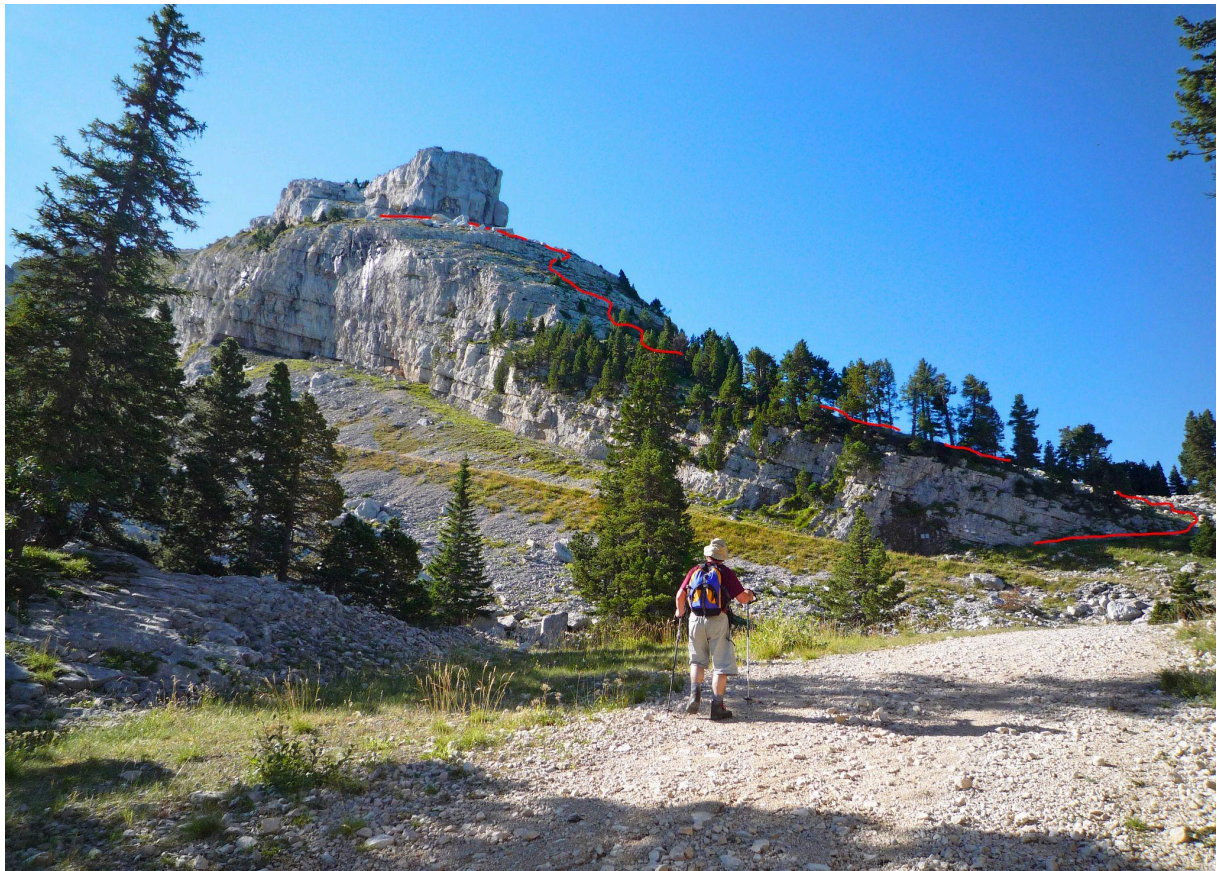
En rouge, l'accès à la Fenêtre de la Moucherolle depuis la piste au pied de l'arête NW;

NB : du pied de l'arête NW, il est possible de revenir au Balcon de Villard-de-Lans en suivant le système de pistes qui traverse la forêt de Villard. On trouve plusieurs raccourcis, mais cela reste assez long et fastidieux.